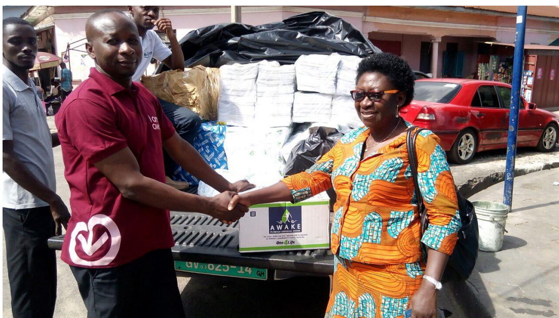
Enthousiast en blijde gezichten op de scholen.