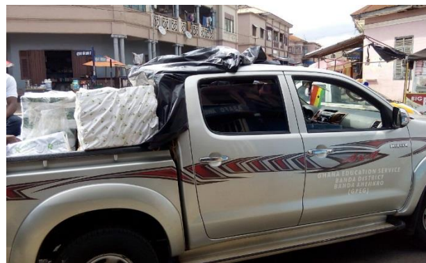
Auto voor district Banda is geladen