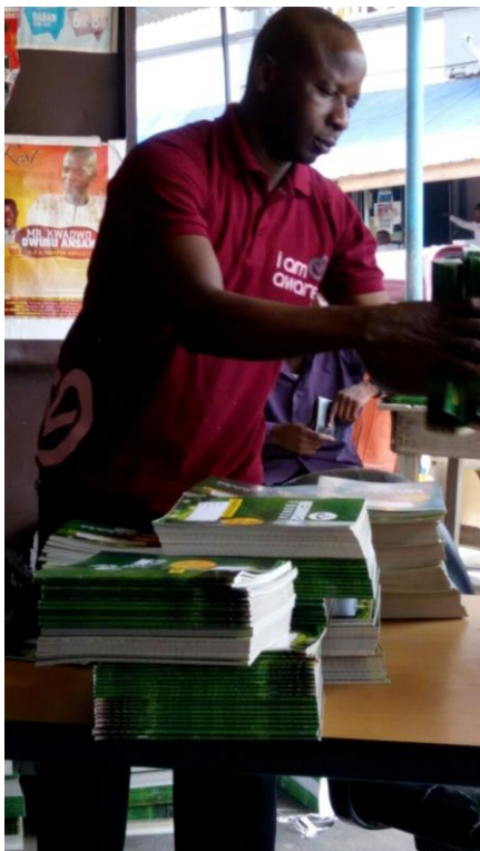
Onze collega sorteert alles