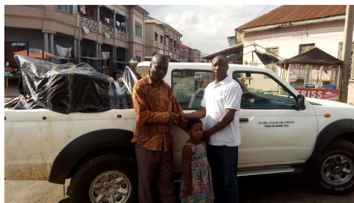
Directeur van Ghana Education Service district Wenchi komt zelf alles ophalen en verdelen over de scholen