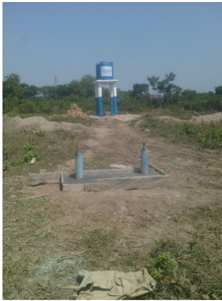
Kranen moeten hier nog aangelegd worden.