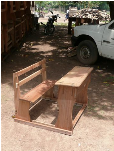
Dit zijn de gewenste meubels.